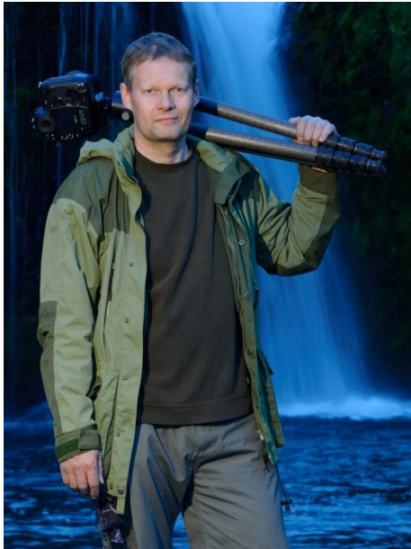
Nú megar rebbar fara að vara sig