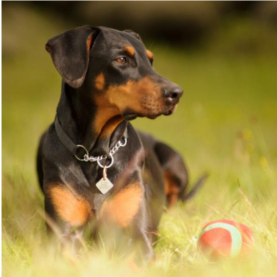
Arwen, ókrýnd drottning fjallanna, alltaf í framsætinu