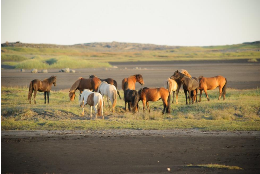
Hestastóð við Stokksnes

harla glaður að geta leyst vandann en hann var sá í stuttri útgáfu að kveikt var á vitlausum takka á ísskápnunum og örygginn í einhverju rugli. Það var nú mikill léttir. Þá var farið í Nettó og Vínbúðina sem er í sama húsi og fyllt á birgðirnar og loks í sundlaugina flottu til að slaka á og skola af sér ferðarykið.