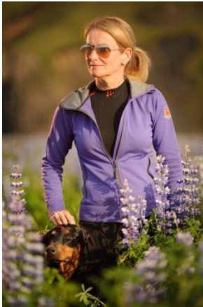
Blómarós meðal lúpína við Hjörleifshöfða