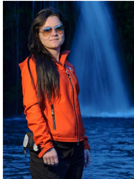
He he, ég er algerlega meðetta